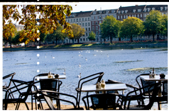
Kasper Thy, Copenhagenmagazine.com