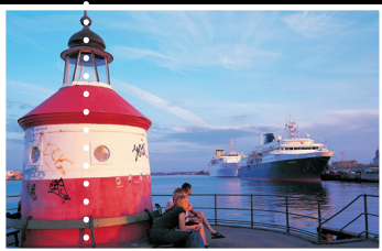
Henrik Stenberg, Viszdanmark.com

Østerbros是位于哥本哈根市中心北部的绿意盎然的豪华上流区。该区在十九世纪以其靠近城市老东门而命名，当时这里还没有构建区域，还只是一个草原奶牛牧场，这在当时是所有市民逃离城市喧嚣的最爱去处。Østerbros并不像其邻区Nørrebro和Vestebro那样杂乱无章地快速建成，起初只是资产阶级把他们豪华气派的别墅建造在这一片绿野之中，许多这样的豪华别墅至今都还存留在此，现在已经变成是许多外国大使馆的驻地。